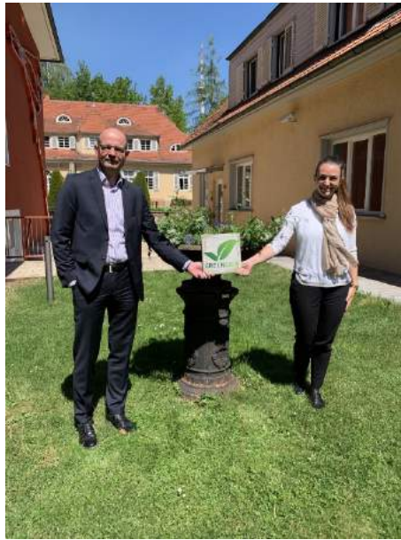
Level 5 von 5

Das Waldhotel Stuttgart erreicht die höchste Green Sign Zertifizierung: